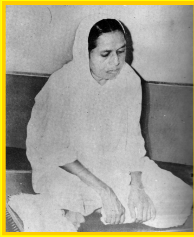
प्रशममूर्ति पूज्य बडेनश्री चंपाबेन