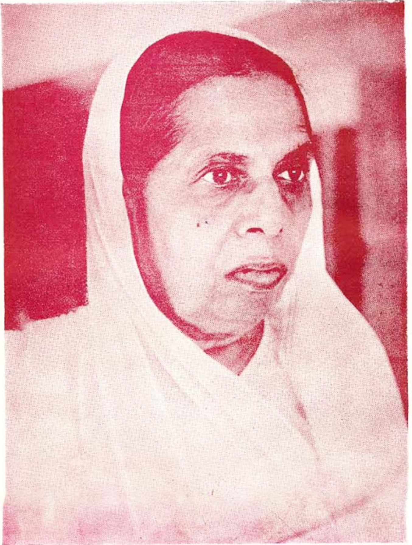
प्रशमभूर्ति भगवती माता पूज्य अडेनश्री चंपाणेन