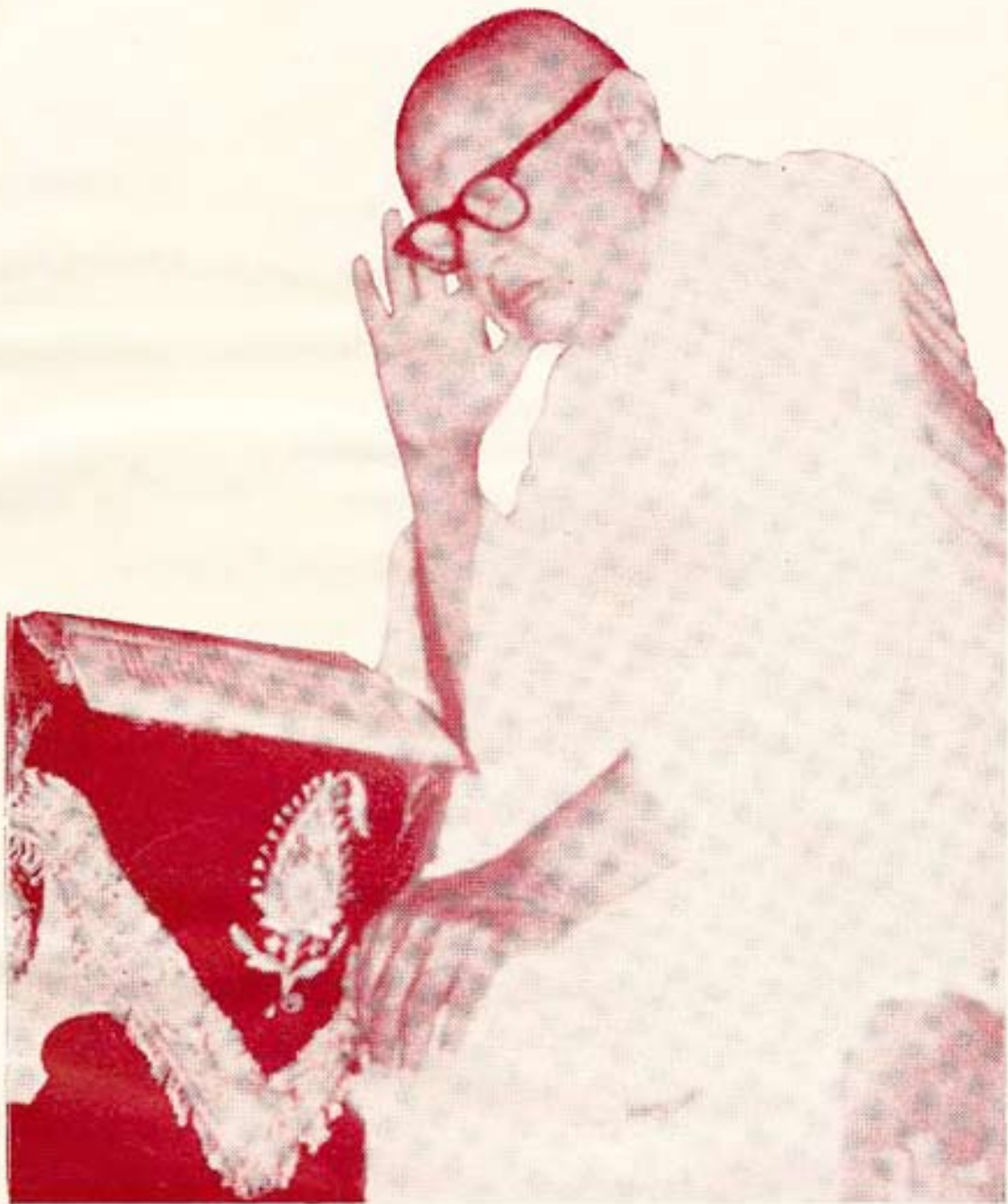
અબ્યાત્મયુગસ્રષ્ટા અનંત ઉપકારી પૂજ્ય ગુરુદેવશ્રી