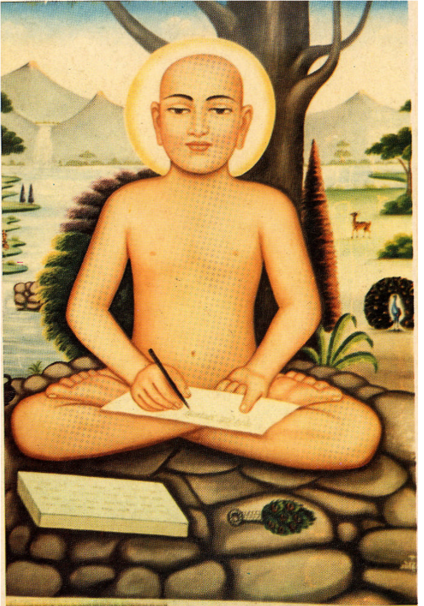
भगवान श्री कुंदकुदाचार्य देव