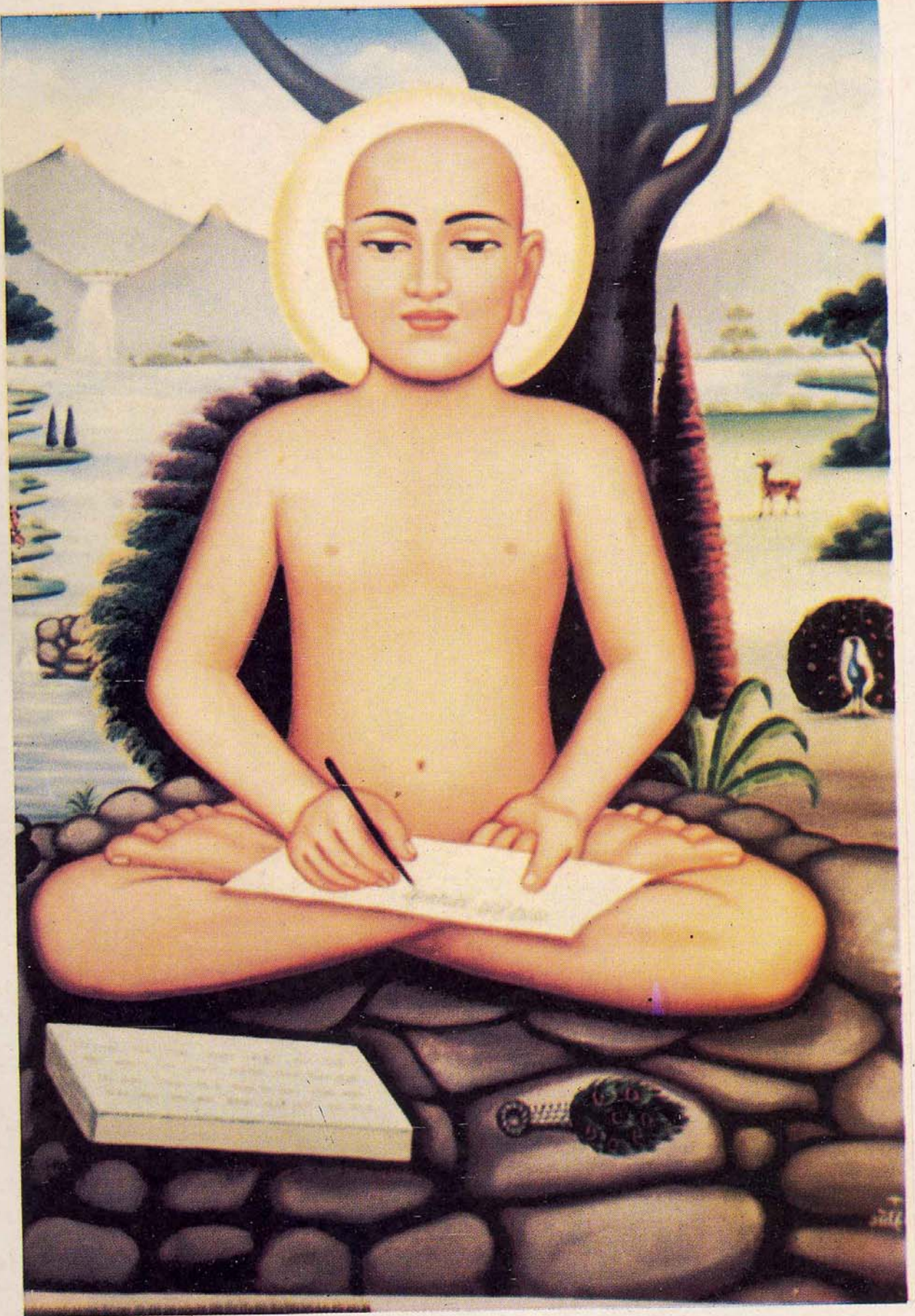
भगवान श्री कुंदकुंदाचार्य देव