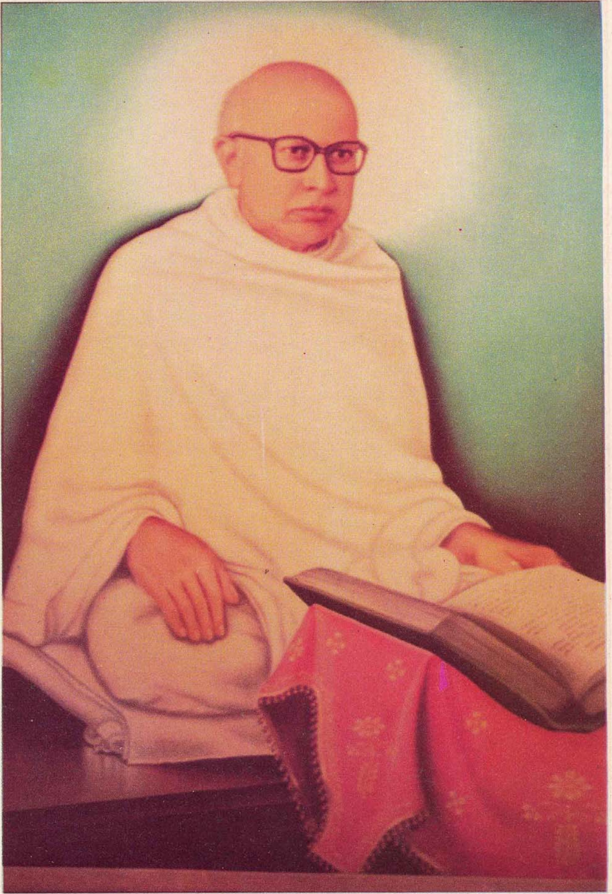
परम पूज्य अध्यात्म सद्गुरुदेव श्री कानजी स्वामी