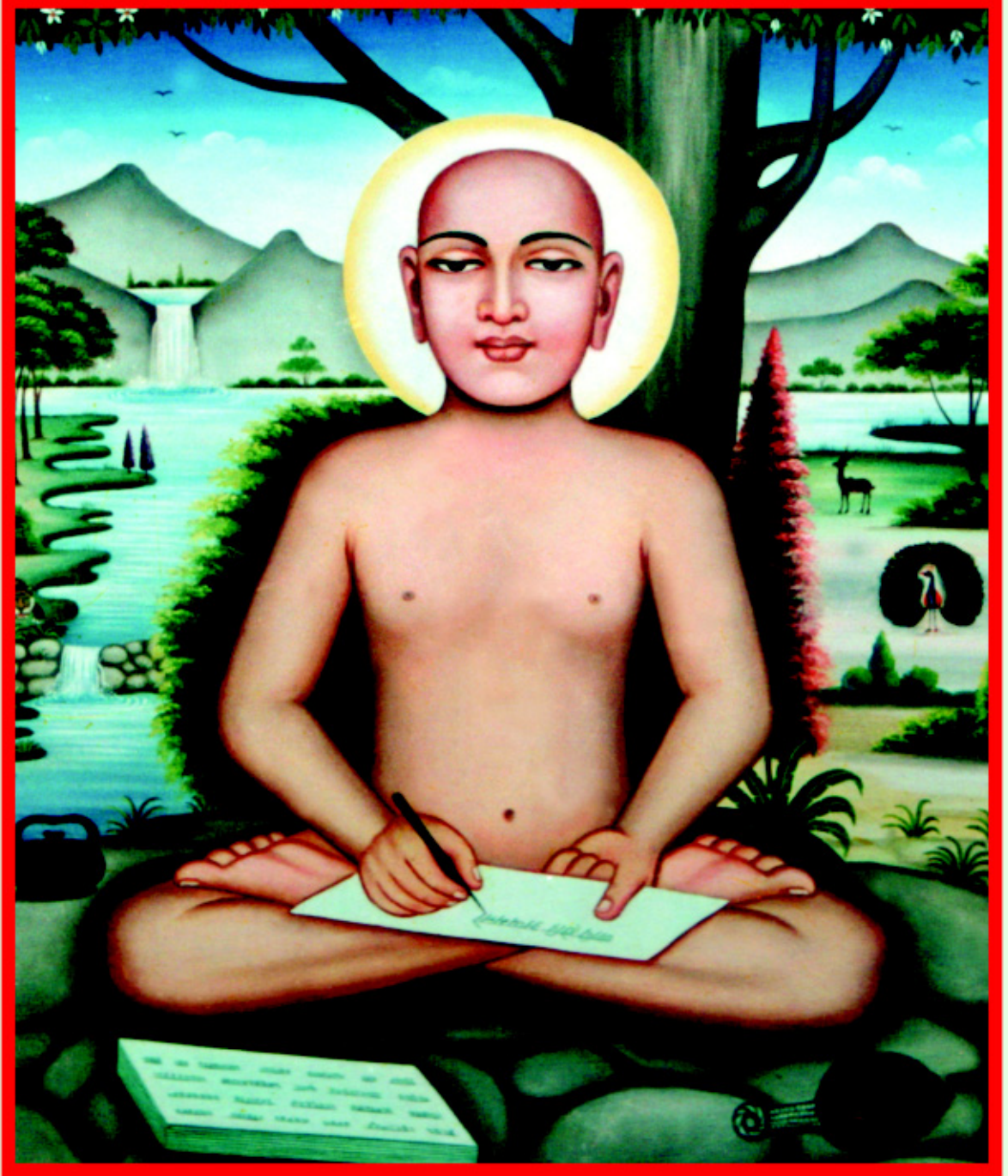
ભરતક્ષેત્રના મહાસમર્થ આચાર્ય ભગવાન શ્રી કુંડકુંડાચાર્યદેવ