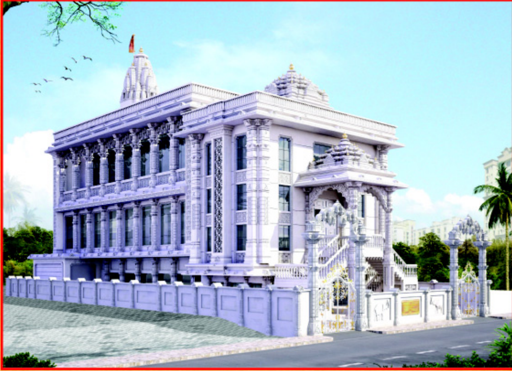
श्री सीमंथरस्वामी दिगंबर जिनमंदिर (विले पाला) मुंबई