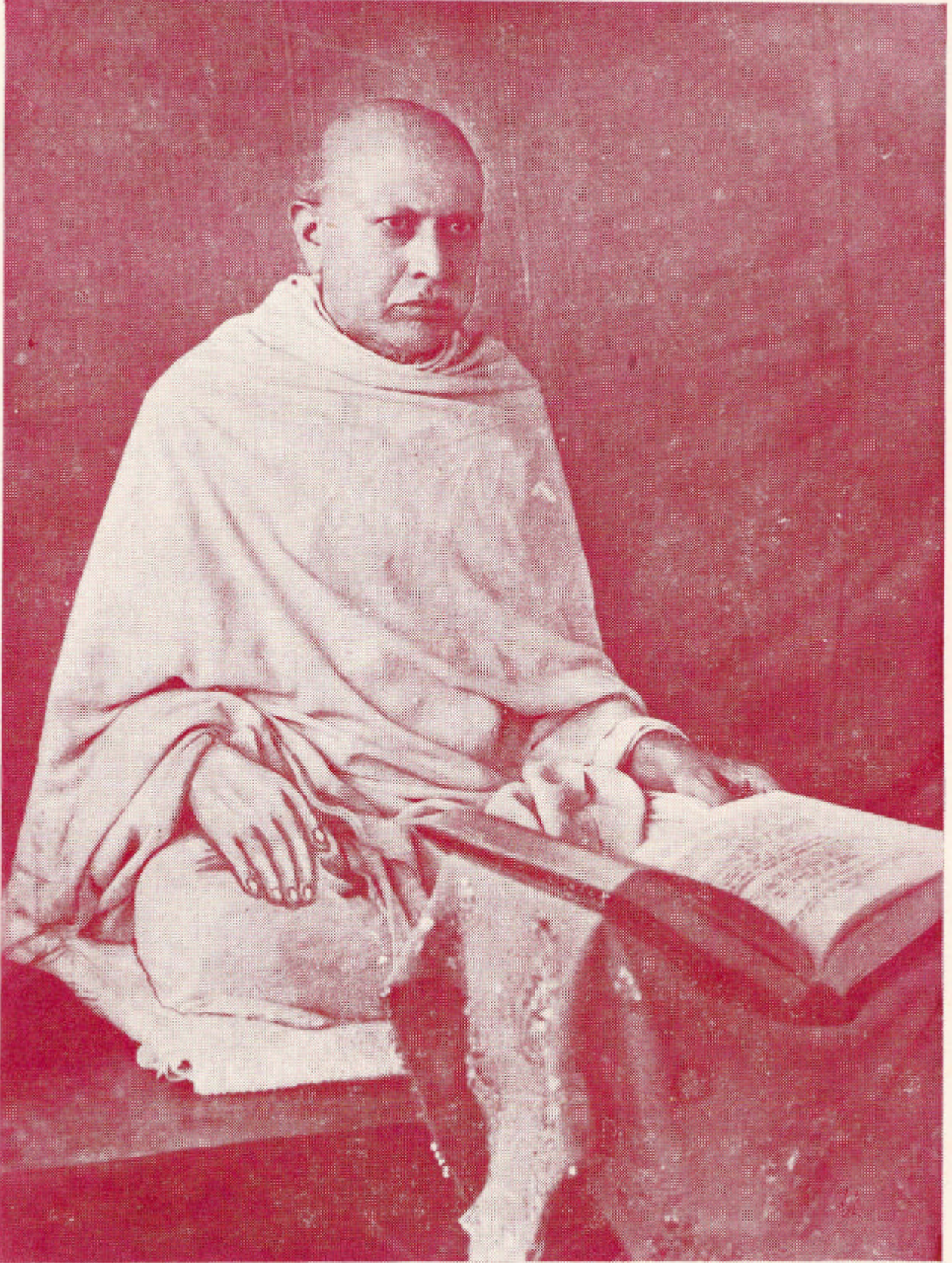
अध्यात्मयुगस्रष्टा परमोपकारी पूज्य गुरुदेव