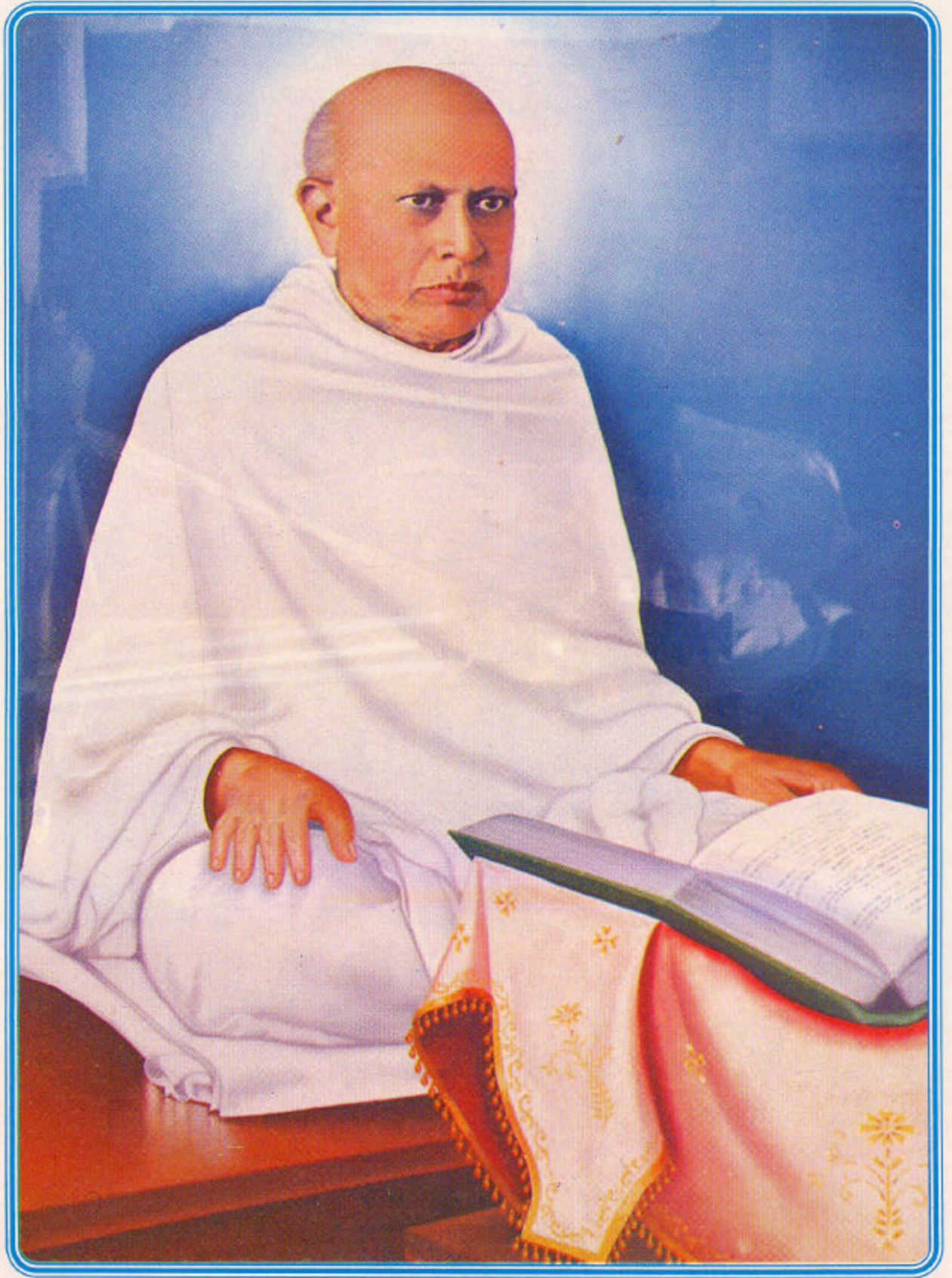
● परमोपकारी पूज्य गुरुदेव श्री कान्जु स्वामी ●