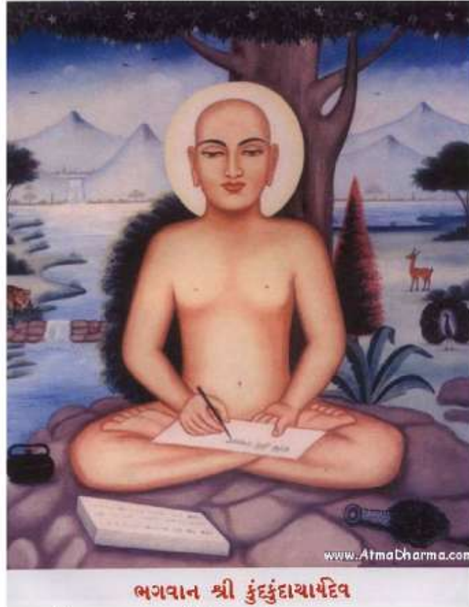
भगवान श्री कुंदकुंदाचार्यदेव

भगवान श्री कुन्दकुन्दाचार्यदेव वनमे ताडपत्र पर शास्त्र रचते हे भगवान श्री कुन्दकुन्दाचार्यदेवके सम्बन्धमें उल्लेख