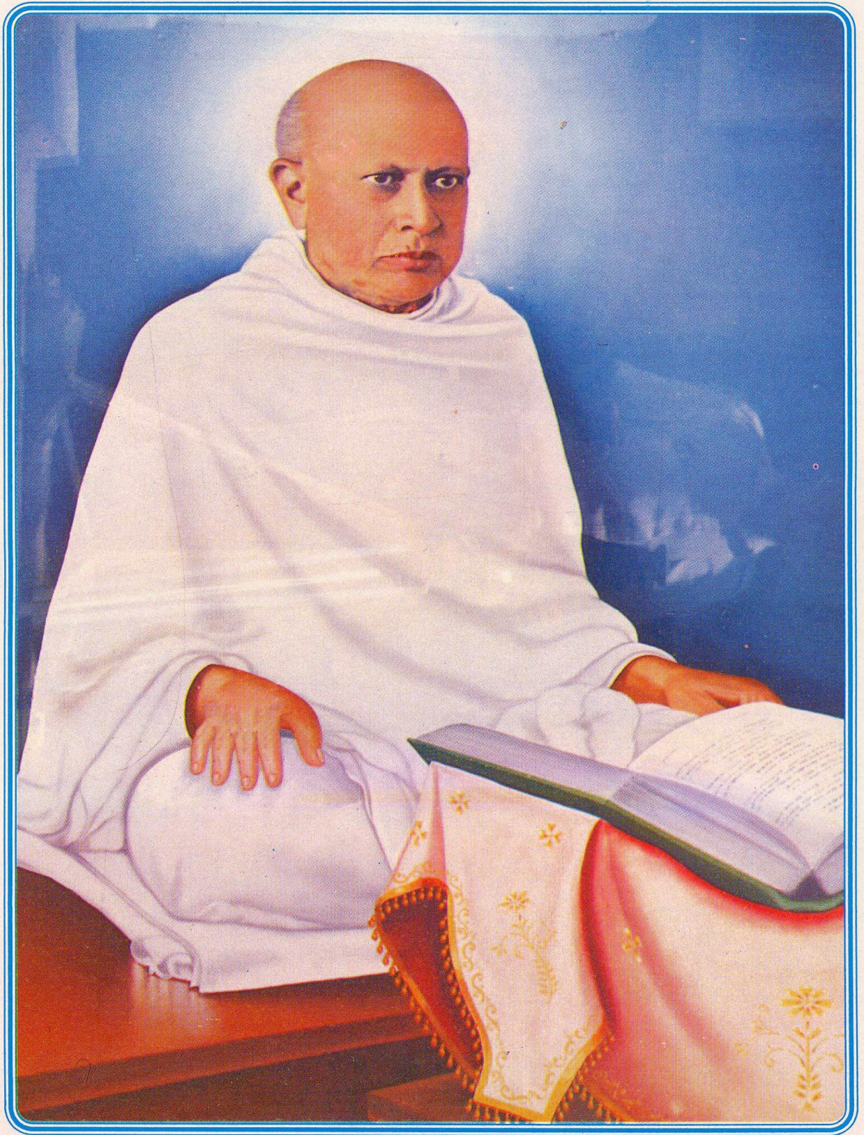
● परमोपकारी पूज्य गुरुदेव श्री कानक स्वामी ●